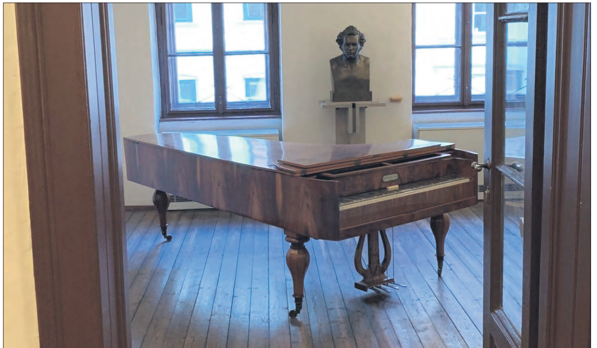
Kamer in Franz Schuberts sterfhuis.

Vaak stel ik me voor hoe de wereld eruitzag aan het begin van de negentiende eeuw. Er zijn nog plaatsen waar sindsdien nagenoeg niets veranderd is, als je tenminste de verkeersborden, auto's en fietsen wegdenkt. En er zijn altijd de stadsgeluiden - een laag gebrom of geronk -, die moet je ook negeren. En boormachines, schuurmachines en bladblazers maken heel veel lawaai. Toch blijkt niet iedereen zich bewust van de geluiden die ons constant omringen. Ik woon nu in een boerendorp en zelfs daar hoor je altijd wel lawaai. Vrachtauto's en motoren zijn doorgaans erg hinderlijk. Heel soms hoor je in de natuur de stilte. De prachtige paden en lanen zijn er nog altijd hetzelfde en je waant je twee eeuwen terug. Er waren natuurlijk de geluiden van mensen en onderschat die van paardenhoeven en koetsen niet. Maar in het algemeen was er, denk ik, beduidend minder lawaai. In Schuberts liedcyclus Winterreise