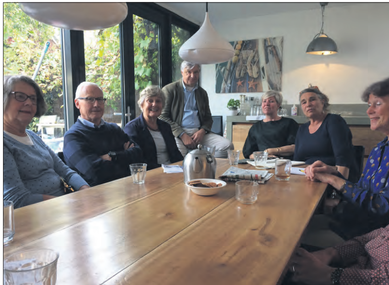
De start-bijeenkomst van het tweede Buurtnetwerk.

Onder het genot van een glas ontspanning vervolgens een geanimeerd gesprek waar het Bestuur LZLO weer het nodige van heeft opgestoken.